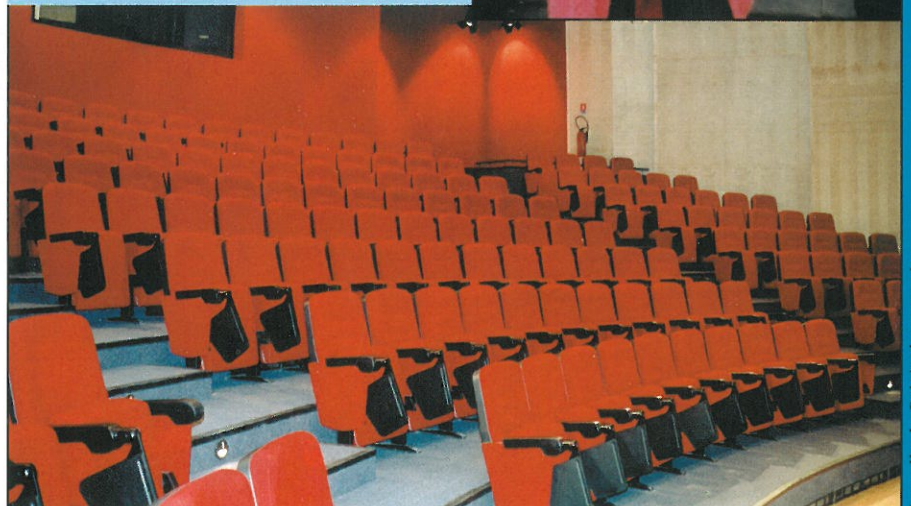
La salle du Palais des congrès.